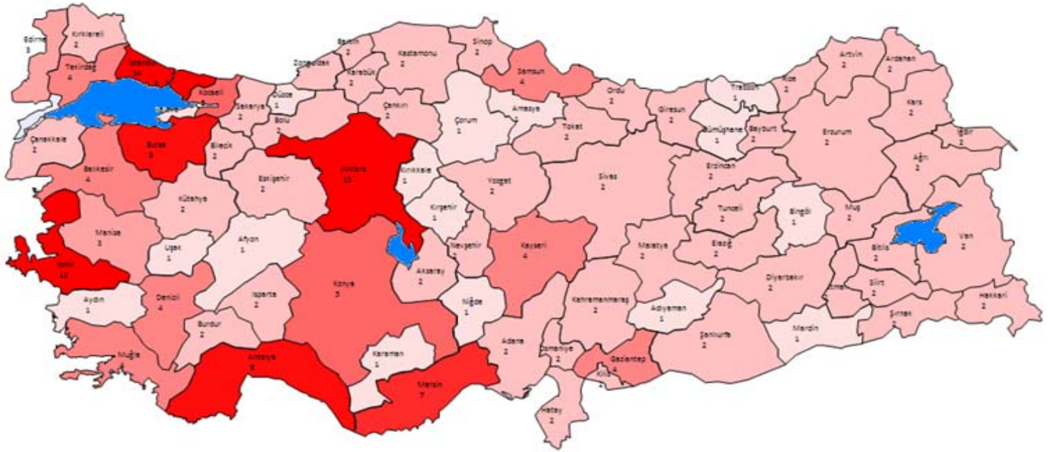
Şekil 2 : İllere Göre Analizi Yapılan Motorin Numune Sayıları

Yapılan araştırma neticesinde analiz raporları ulaşmayan lisans sahiplerinin istasyonlarının kapalı veya tadilatla olduğu ya da istasyonda ürün bulunmadığı tespit edilmiştir. Buna karşın her bir ilden en az bir numune alınmıştır.