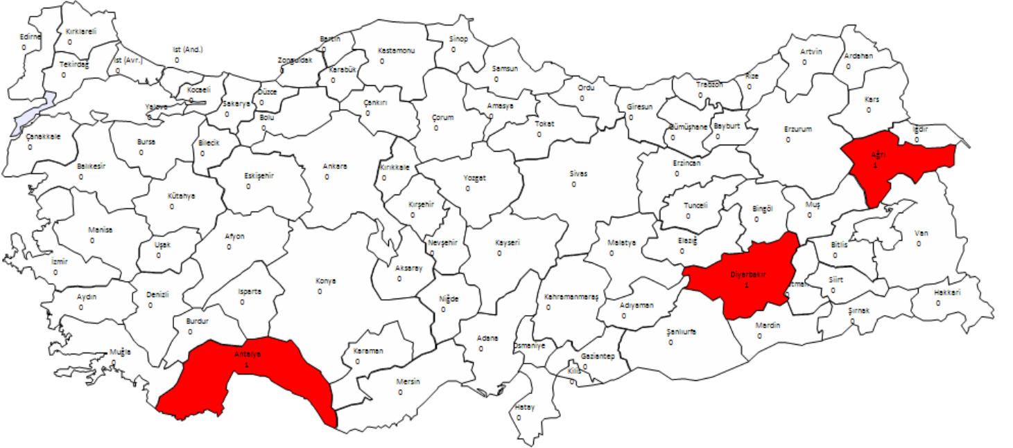
Şekil 5 : İllere Göre Teknik Düzenlemelere Aykırı K. Benzin 95 Oktan Numune Sayısı

Teknik düzenlemelere aykırı numuneler Ağrı, Antalya ve Diyarbakır illerinden alınmıştır. Ağrı iline ait numunenin “araştırma oktan sayısı” parametresi, Antalya ve Diyarbakır illerine ait numunelerin ise “kaynama noktası sonu” ve “araştırma oktan sayısı” parametreleri ilgili teknik düzenlemelere aykırı çıkmıştır.