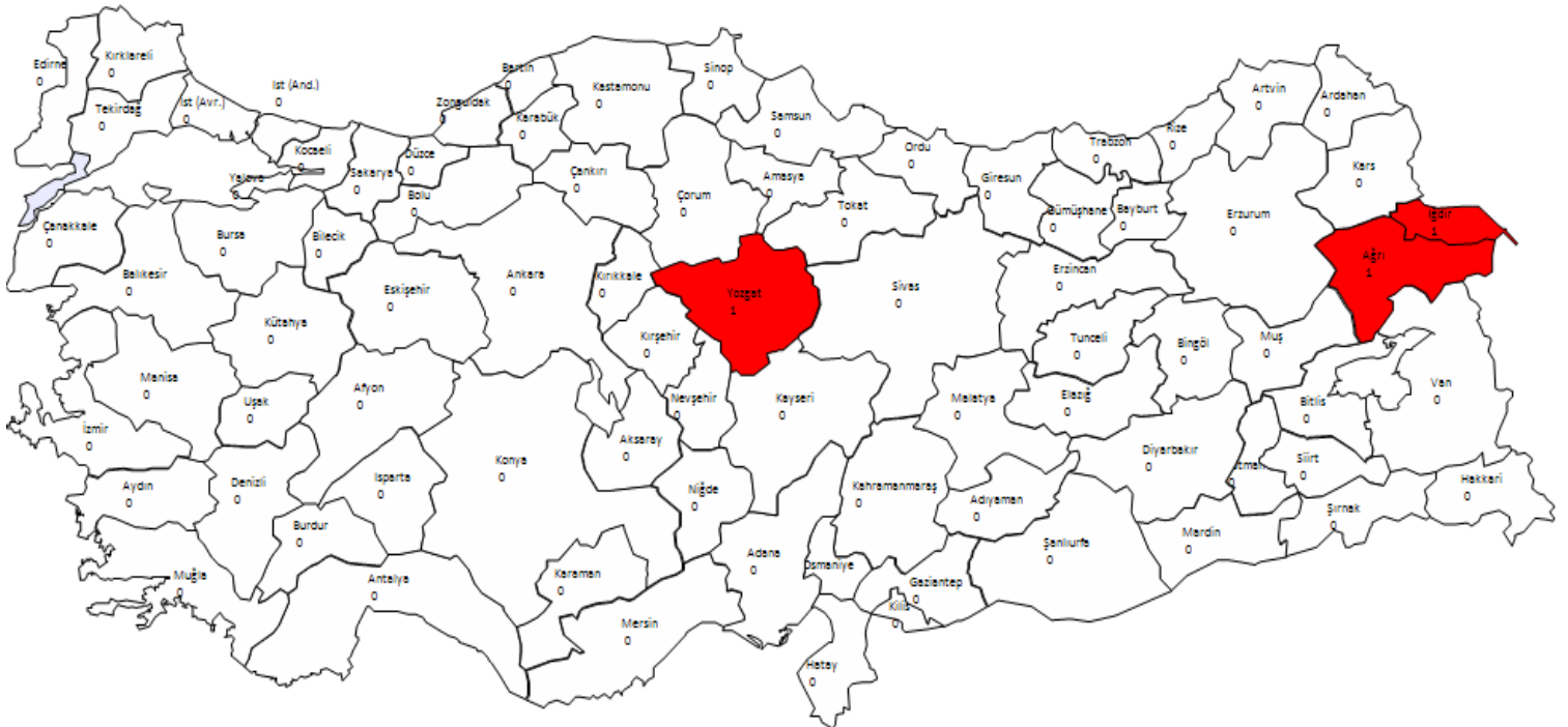
Şekil 3 : İllere Göre Teknik Düzenlemelere Aykırı Motorin Numune Sayısı

Teknik düzenlemelere aykırı motorin numuneleri Ağrı, Iğdır ve Yozgat illerinden alınmıştır. Numunelerin sadece “kükürt” parametresi ilgili teknik düzenlemelere aykırı çıkmıştır. Iğdır ilinden alınan numunenin kükürt parametresi 14 ppm’dir. (Geçiş sürecinde 20 ppm’e kadar muafiyet tanınmıştır).