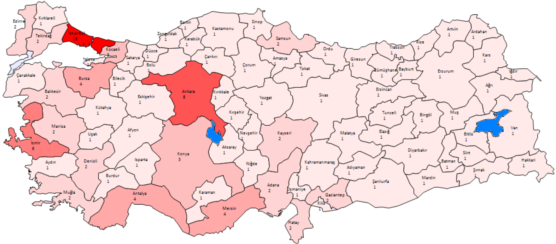
Şekil 1 : İller Bazında Yaz ve Kış Dönemlerinin Her Birinde K. Benzin 95 Oktan ve Motorin Türleri İçin Seçilen Örnek Sayıları

Örnek Açıklama: Ankara ilinde yaz dönemi için 8'er adet motorin ve kurşunsuz benzin 95 oktan numunesi, kış dönemi için 8'er adet motorin ve kurşunsuz benzin 95 oktan numunesi alınmıştır.